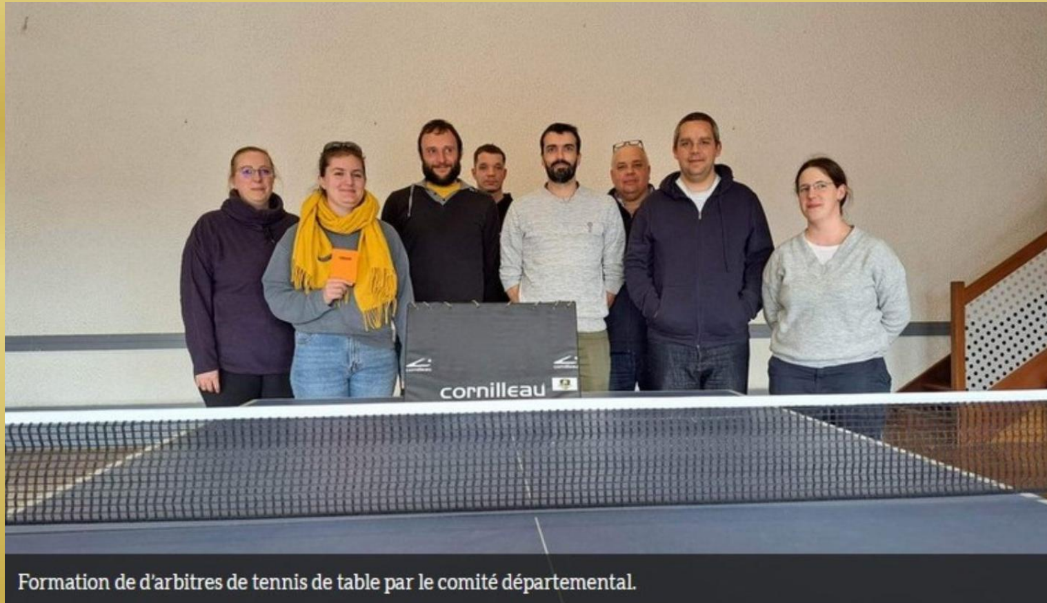
Formation de d'arbitres de tennis de table par le comité départemental.